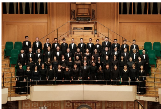
香港管弦樂團合唱團