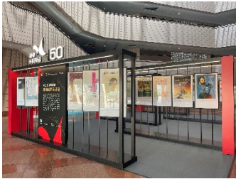
半世紀音樂巡禮：港樂經典海報選