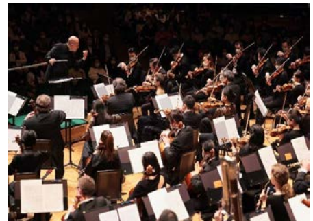
香港管弦樂團