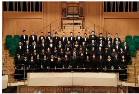
香港管弦樂團合唱團