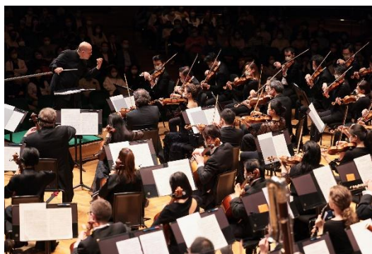
香港管弦樂團